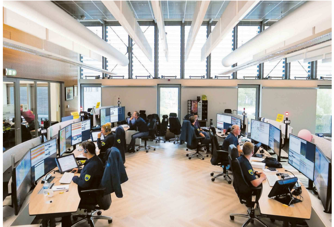
Tijdens de verbouwing gaan de werkzaamheden onverminderd door.

zogeheten uitwijkruimte. Het duurt drie dagen om de meldtafels weg te halen en nog eens drie dagen om het tapijt te verwijderen en een nieuwe pvc-vloer te plaatsen. In de tweede week komen de nieuwe tafels en worden deze klaargemaakt. „Al met al ben je dan zestien weken bezig”, zegt Bruynooge. Dat wil zeggen: als het project geen vertraging oploopt. Tot nu toe gaat het goed. Iedere zaterdag is een uitlooptag, mocht het doordeweeks niet goed gaan. Maar deze is nog niet nodig geweest. „We hebben geen verstoringen gehad in telefonie. De verbouwing is uitdagend, maar er gaat weinig mis. Soms bevriest een beeldscherm kort, maar dat los je dan ook gauw weer op.” Om geluidsoverlast binnen te beperken te houden, had men het idee opgevat om plastic schotten bij de meldtafels neer te